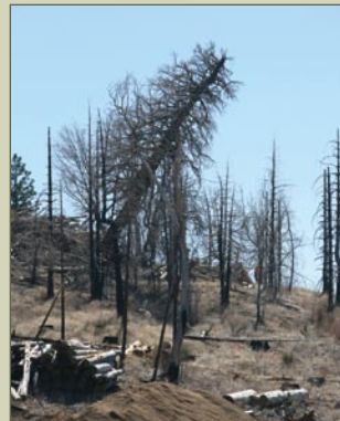
El millonésimo árbol muerto fue recogido a principios del 2007.

Fundada en el 2002, la Mountain Area Safety Taskforce (MAST) es una coalición de agencias gubernamentales locales, estatales y federales, empresas privadas, y organizaciones de voluntarios del Condado de San Bernardino interesadas en la seguridad pública de las áreas montañosas.