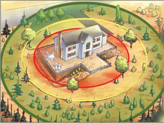
Un área periférica despejada de maleza y vegetación ayuda a proteger a su vivienda de incendios forestales.