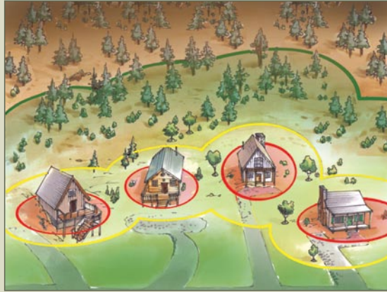
La seguridad contra incendios es un esfuerzo que involucra a toda la comunidad. Cuando las viviendas están cerca una de la otra, la mejor manera de defender su hogar es colaborando con sus vecinos.